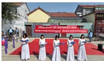
重阳节慰问老人活动