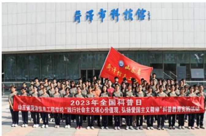
参观菏泽市科技馆