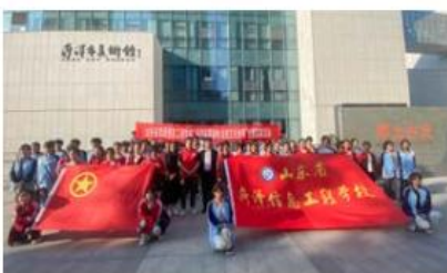
菏泽市美术馆主题实践活动