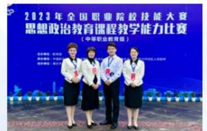
2023年教学能力大赛思政课全国一等奖