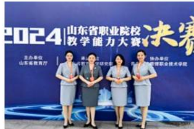
2024年山东省职业院校教学能力大赛二等奖