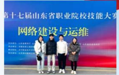
2024年山东省职业院校技能大赛网络建设与运维二等奖