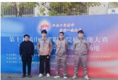
2024年山东省职业院校技能大赛“现代加工技术（师生同赛）”三等奖