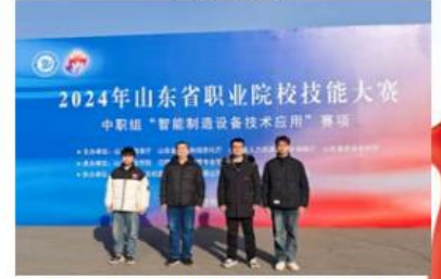
2024年山东省职业院校技能大赛“智能制造设备技术学生赛”三等奖