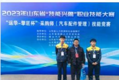
2023年山东省技能兴鲁职业技能大赛采购师项目二等奖