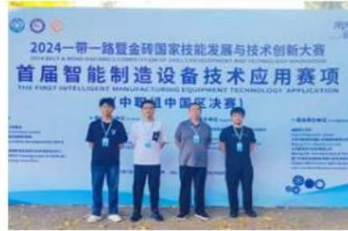
2024年一带一路暨金砖国家技能发展与技术创新大赛首届智能制造设备技术应用赛项三等奖