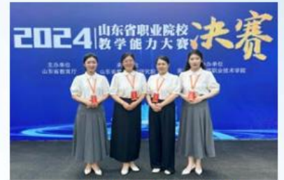
2024年山东省职业院校教学能力大赛二等奖