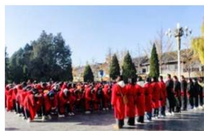
“承先贤之礼、沐儒风雅韵” 师生曲阜研学活动