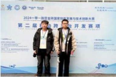
2024年一带一路暨金砖国家技能发展与技术创新大赛二等奖