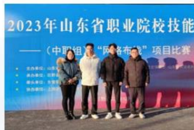
2023年山东省职业院校技能大赛二等奖