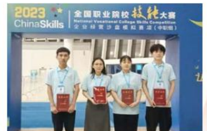
2023年全国职业院校技能大赛“企业经营沙盘模拟”赛项三等奖