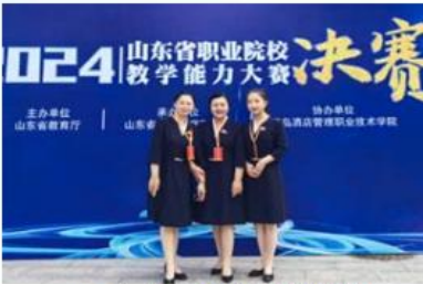
2024年山东省职业院校教学能力大赛一等奖