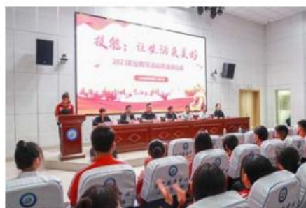
技能 - 让生活更美好 职业教育活动周 演讲比赛