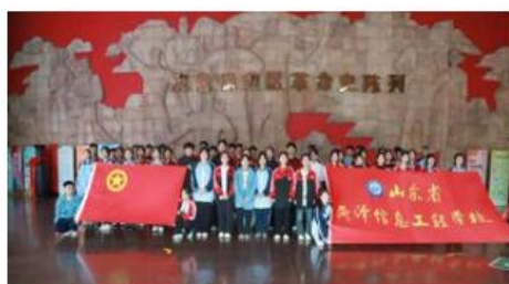
2023年参观“冀鲁豫纪念馆”活动