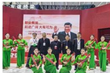
世界职业技术教育发展大会上舞蹈表演专业学生