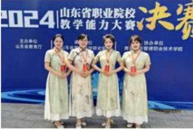
2024年山东省职业院校教学能力大赛二等奖